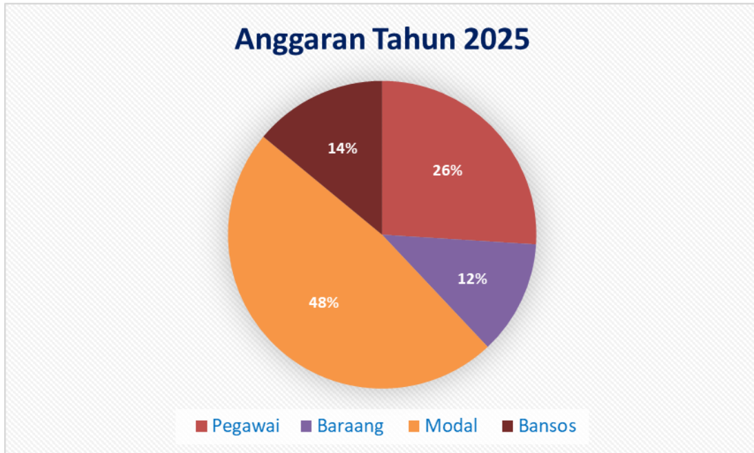
Tabel 1.5 : Anggaran TA 2025